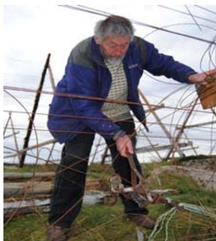
Gamle fiskehjeller skiftes ut med nye. Mange vendinger for en vant dugnadsarbeider.